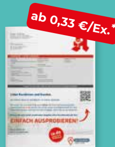
my life mit individueller Rückseite