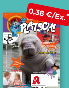
„PLATSCH!“ Das Kindermagazin

* Alle Preise gelten zzgl. MwSt.; darüber hinaus gelten die allgemeinen Vertrags- und Geschäftsbedingungen des Zukunftspakts Apotheke. Für Kunden, die zu Werkzeiten nicht regelmäßig von teilnehmenden Großhändlern beliefert werden, fallen zusätzlich Verpackungs- und Versandkosten von 16,80 € monatlich für das Basispaket (my life ohne TV-Teil) an. Für Zusatzbuchungen über das Basispaket hinaus (TV-Teil, weitere Hefte der my life-Magazinfamilie) werden Verpackungs- und Versandkosten auf die tatsächlich bestellte Menge erhoben. Dafür werden die Bestellmengen und Ausstattung (mit/ohne TV) in Verpackungseinheiten umgerechnet. Jedes Paket kostet 8,40 €. Das Team Zukunftspakt Apotheke berechnet auf Anfrage gerne die Versandkosten für Zusatzbuchungen.