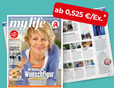
my life + TV-Teil