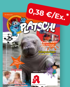
„PLATSCH!“ Das Kindermagazin

* Alle Preise gelten zzgl. MwSt.; darüber hinaus gelten die allgemeinen Vertrags- und Geschäftsbedingungen des Zukunftspakts Apotheke. Für Kunden, die zu Werkzeu- nicht regelmäßig von teilnehmenden Großhändlern beliefert werden, fallen zusätzlich Verpackungs- und Versandkosten von 16,80 € monatlich für das Basispaket (my life ohne TV-Teil) an. Für Zusatzbuchungen über das Basispaket hinaus (TV-Teil, weitere Hefte der my life-Magazinfamilie) werden Verpackungs- und Versandkosten auf die tatsächlich bestellte Menge erhoben. Dafür werden die Bestellmengen und Ausstattung (mit/ohne TV) in Verpackungseinheiten umgerechnet. Jedes Paket kostet 8,40 €. Das Team Zukunftspakt Apotheke berechnet auf Anfrage gerne die Versandkosten für Zusatzbuchungen.