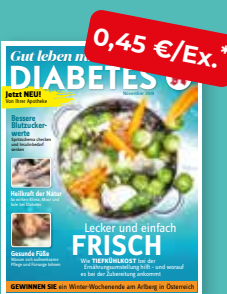
Gut leben mit DIABETES