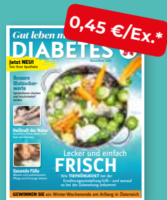
Gut leben mit DIABETES