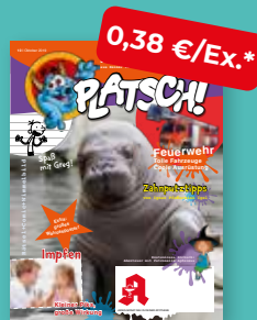
„PLATSCH!“ Das Kindermagazin